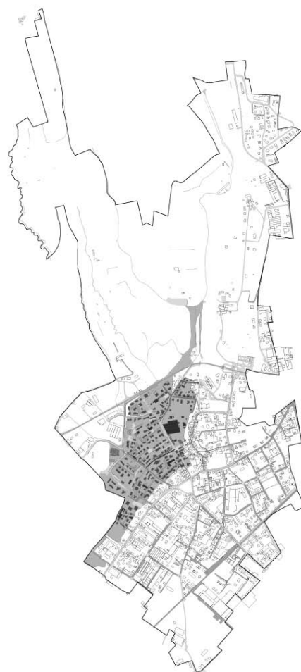
Zone a rischio in caso di tracimazione della vasca di laminazione