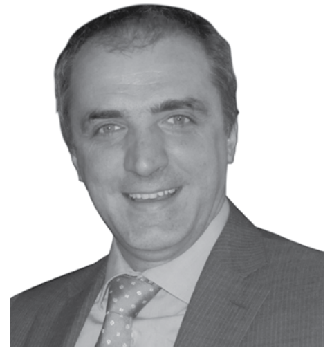
Daniele Colombo Sindaco

Proprio in relazione al quadro degli investimenti che si intende realizzare nel corso dei prossimi tre anni, occorre attendere, a breve, quello che sarà l'esito di importanti trattative che nel corso di questi anni sono state portate avanti dall'Amministrazione Comunale e che negli ultimi mesi dello scorso anno hanno subito una improvvisa e ben accetta accelerazione. Si tratta di interventi destinati a riqualificare completamente due aree importanti per il tessuto urbano carughese: l'area Tamburini e l'ex area Nespoli.